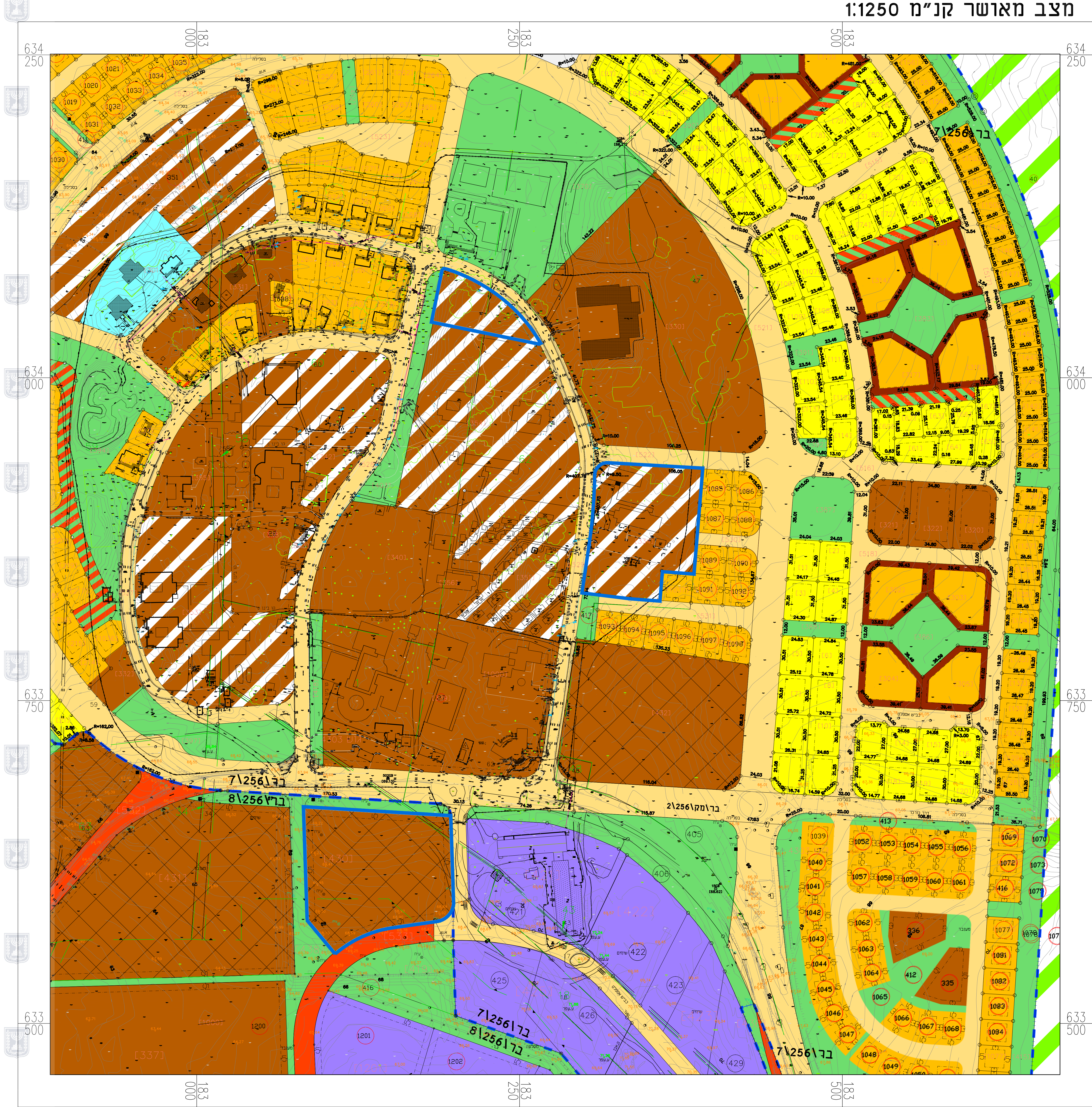
מצב מאושר קנ"מ 1:1250